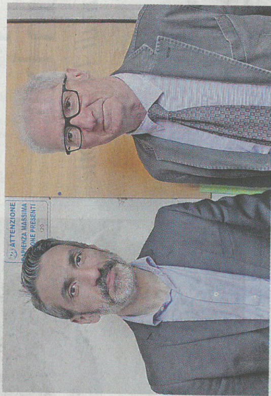
FUTURO Sopra, da sinistra il vice direttore scientifico dell'Istituto italiano di tecnologia, Giorgio Metta e il docente Amedeo Santosuosso; sulla destra, e il 'robot bambino' iCub

«DA 10 ANNI - racconta Giorgio Metta sta lavorando per portare nelle case un robot da compagnia - l'Istituto italiano di tecnologia ha investito nello sviluppo di ricerca robotica. In particolare, il nostro obiettivo è sviluppare tecnologie a basso costo per costru-