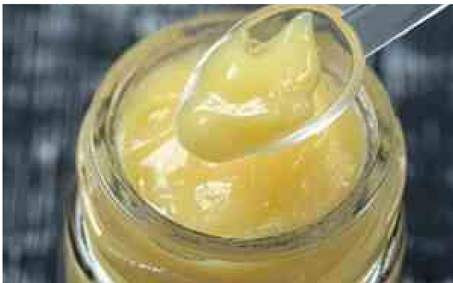
Numero uno contro l'obesità addominale. Perdi 1,2 chili ogni 24 ore Sliminazer