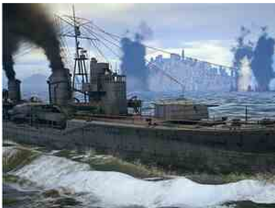
Il gioco più atteso dai giocatori di tutto il mondo Gaijin Entertainment