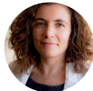
Anna Laura Orrico